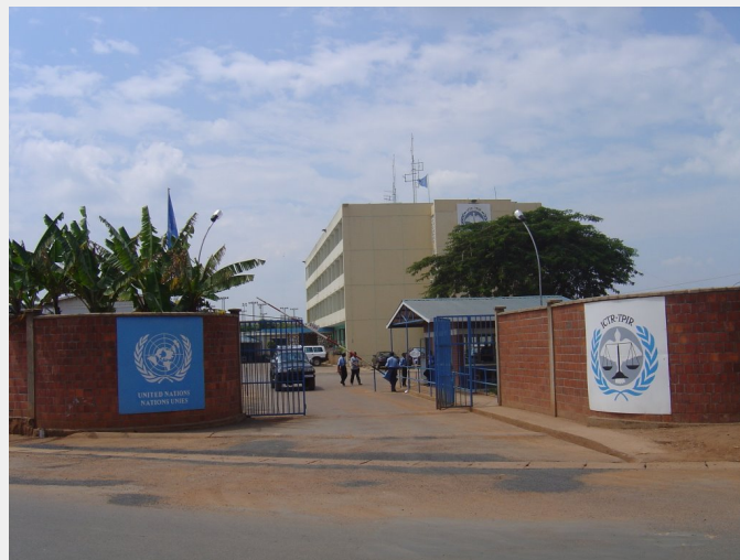
QG de la MINUAR à Kigali

Il est important que le financement de ce projet soit majoritairement africain, pour que ce film puisse exister et être diffusé en tant que production africaine. Et d'avoir la possibilité de bénéficier des droits réservés pour le Sénégal et le Rwanda, afin que les lycées, universités et chaînes de télévisions nationales aient accès librement au film et puissent en assurer la diffusion.