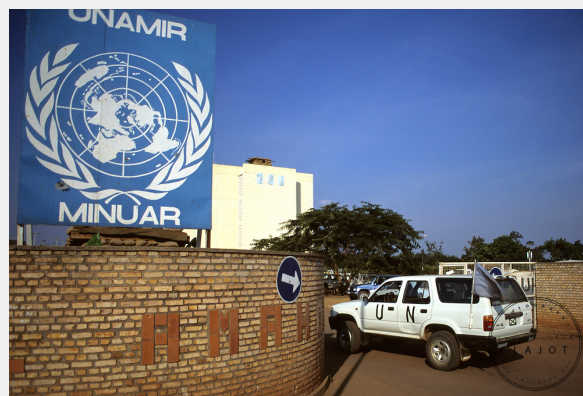
QG de la MINUAR à Kigali

Parallèlement au développement de ce film, un mémorial sera créé à la mémoire du capitaine Mbaye Diagne et aux victimes du génocide perpétré contre les Tutsis du Rwanda en 1994. Huit cent arbres, autant de vies que ce soldat à sauvées, seront plantés aux abords de la Muraille Verte, à Dahra, au nord-est du Sénégal.